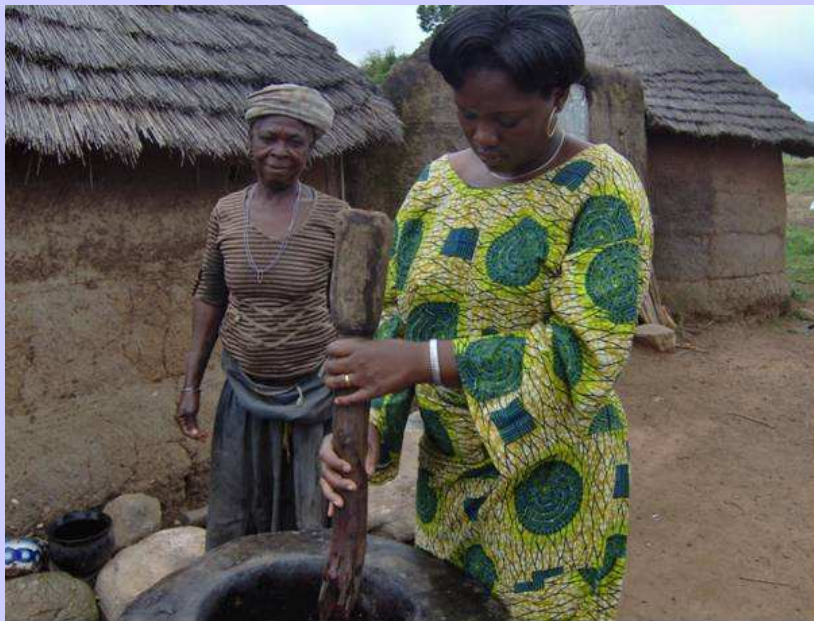
Flora grinding baobab seeds with mortar and pestle

Ga mee OpStap met het Vrouwennetwerk Wageningse Ingenieurs (VWI) en reserveer zaterdag 7 november 2009 in de agenda voor het symposium in Wageningen. Roos Vonk is ondermeer bekend van haar columns in Intermediair en Psychologie Magazine en weet met humor en enthousiasme haar publiek te boeien. Lees meer>>>